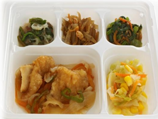
鶏肉と野菜の南蛮漬