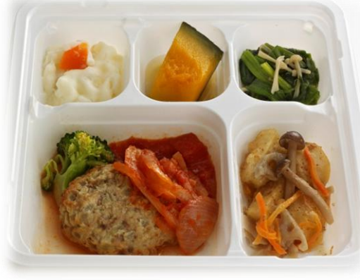
手こねハンバーグ・自家製 トマトソース