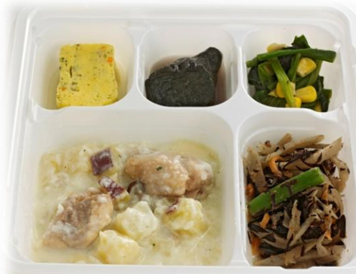
鶏と根菜のクリーム煮