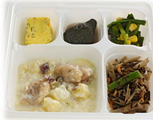
鶏と根菜のクリーム煮