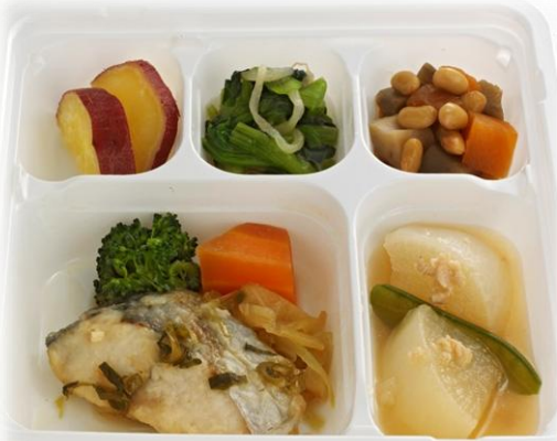
サワラのねぎソースセット