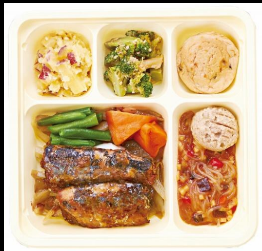
さんまのやわらか煮