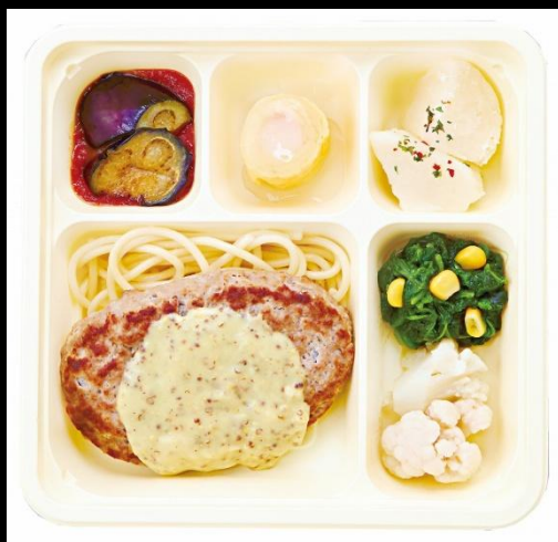
ハンバーグマスタードソース