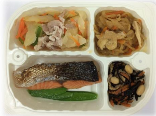
国産鮭の塩焼きセット