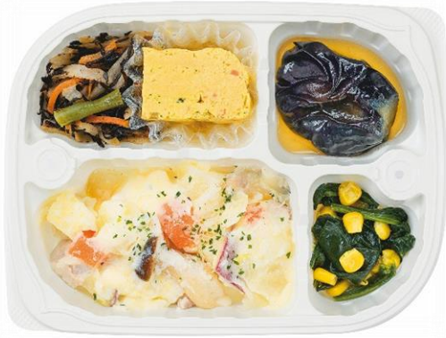
鶏と根菜のクリーム煮セット