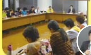
TPP学習会(社会委員会企画)