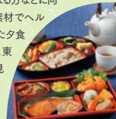
※画像は献立イメージです

高齢化社会に向けた福祉の一環として、また忙しい方、栄養バランスが気になる方などに向け、安全・安心な素材でヘルシーにこだわった夕食を宅配しています。東都生協ならではの見守りや情報提供など、安心できる生活を支援します。