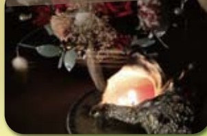
100万人のキャンドルナイト (年2回、夏至と冬至の夜)