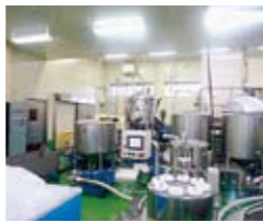
驚くほど清潔。ユニオンソース(株)の産直マヨネーズ製造ライン。

東都生協が指定した(有)匠環ジューピーセンターの全卵を使用。なたね油・酢などに遺伝子組換え原料は使っていません(Non-GMO)。化学調味料も使わず、素材そのものの味を生かしています。マイルドで口当たりがよいので、野菜と相性ぴったり。産直野菜と一緒にどうぞ。