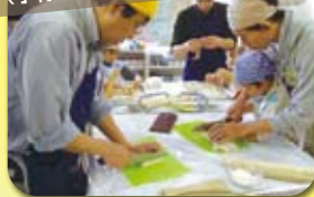
パパと一緒にうどんづくり (子育て委員会企画)