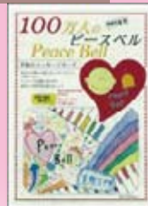
100万人のピースベル