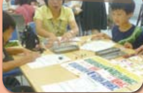
消費者力公開講座