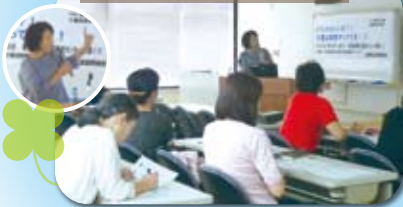
介護学習会(くらし委員会企画)