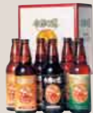
石川酒造(株)組合員の交流訪問でも人気です。

500ml 3種6本セット 5,250円 ミュンヘンダーク・ピルスナー・パールエールの3種を2本ずつセット。それぞれがはっきりとした個性を持ち、深みのある味わい、芳醇な香りは、まさに本物!