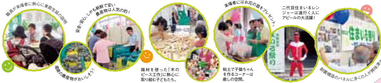
職員が来場者に熱心に東都生協の説明

自然災害にみまわれた今年は、住まいについても考えた1年でした。「東都生協住まいの祭り」は、住まいの提携業者会「住まいの会」が主催。「耐震!省エネ!匠の技!」をテーマに、住まいの展示コーナー、専門家によるセミナーや相談コーナー、そしてお楽しみコーナー……と、バラエティーに富んでいました。開場後は時間を追うごとに来場者は増加し、用意したお花の苗も勢い良く減りました。産直野菜展示即売コーナーでは夏野菜が並び、みずみずしいトマト、きゅうり、おくら、玉ねぎ、じゃがいも、旬の巨峰など、お手頃価格で販売。偶然立ち寄った男性は、「原発事故以来、安心できる野菜を探していた。放射能検査もしっかりしていて安全な野菜と分かり良かった」と商品案内を手いうれしそうでした。「一度脱退しましたが、今日また復活しました!」という子ども連れのお母さんも! 当日の来場者は320人、その内12人が加入しました。一人でも多くの人に東都生協の良さが理解され、うれしい瞬間でした。震災後は何気ない日常生活の大切さ、衣食住の安定の大切さを実感した私たち。東都生協が提供・発信する「安心の住まい」と「安全な食」で、一人でも多くの組合員のスマイルが今後も続くことを祈った一日でした。