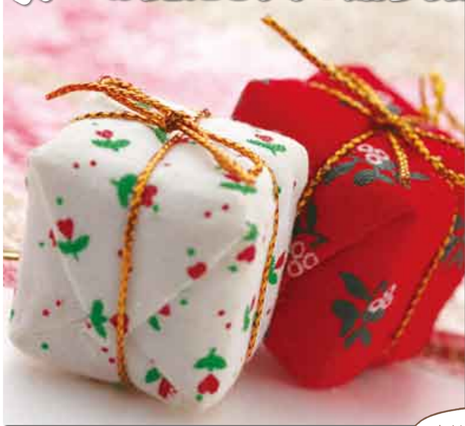
素材のウチク 14 季節の贈り物