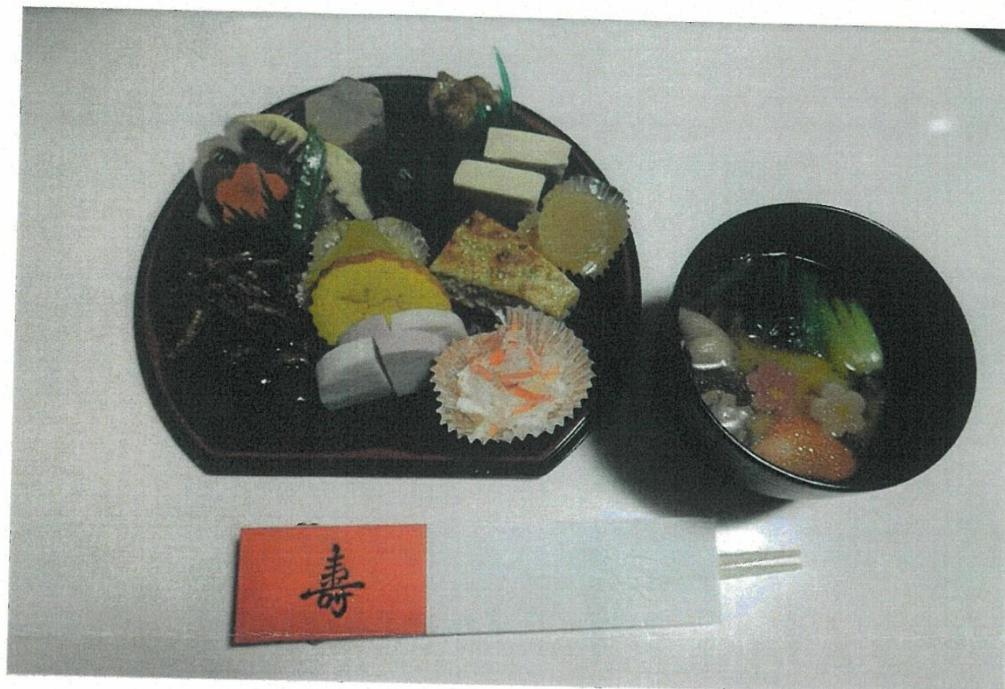
完成したおせち料理とお雑煮