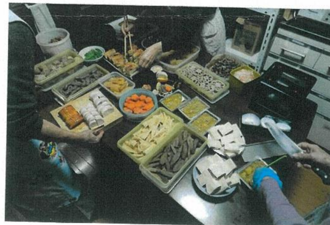
おせちを作っている場面2