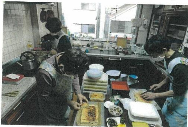
おせちを作っている場面1