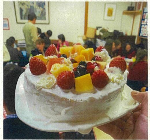
近所のおじちゃん・おばちゃんクラブ 第3回目助成事業活動「卒業スペシャルメニュー」