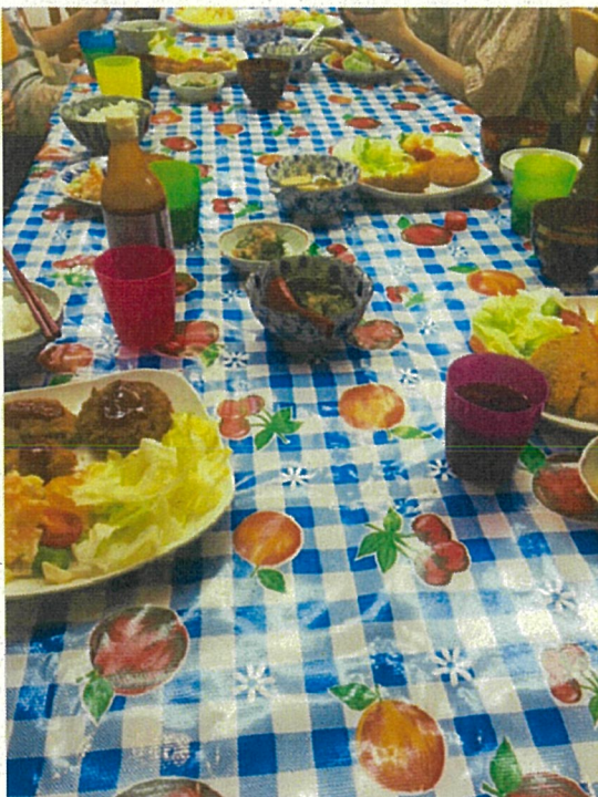
寺子屋食堂夏休みスペシャルメニュー

季節・行事に合わせ、東都生協の助成品（食材）で、スペシャルメニューとして子どもたちに提供できたことは予想以上に子どもたちの喜びや満足感が生まれ、大成功だったと思います。活動の趣旨である「地域の子どもたちの孤食・孤立を防ぎ、成長し合う居場所作り」も着実に成果が上がっていると思います。さらに、さまざまなボランティアが活動にかかわっている中で、ボランティアメンバーの居場所にもなっており、多世代交流の場に変わっていることも大きな成果（手ごたえ）と感じています。東都生協の助成品（食材）は、生産者と直結した「産直」で、原材料も良質であり、子どもたちの味覚が豊かになる一助になっていると感謝です。「未来につなぐ募金」の助成事業は、今後もずーっと継続してほしいと思います。