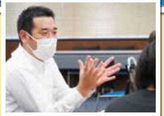
9月30日(土)開催 東都生協ラボ みんなで考えようSDGs企画