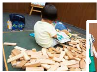
間伐材を使った がまぼこ積みコーナー