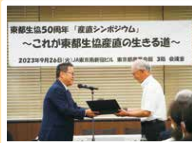
9月26日(火)産直シンポジウム 永年取引感謝状贈呈式