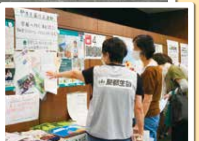
東都生協ラボ研究員説明風景