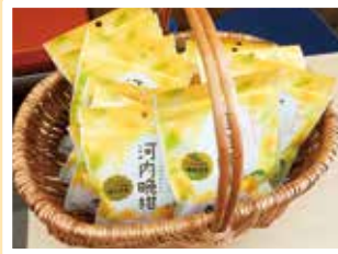
河内晩柑やわらかドライフルーツ