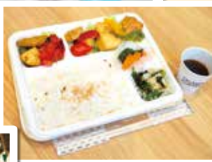
東都生協の食材を使った フェアビンドンの 手づくり弁当販売