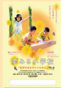
9月29日(金)開催 東都シアター