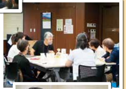
9月27日(水)・28日(木)開催 産地・メーカーと 組合員との交流会