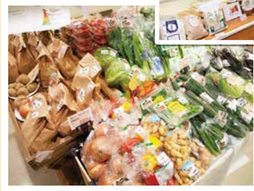
店舗内風景 青果・米・わたしのこだわり・ 東都ナチュラル商品など