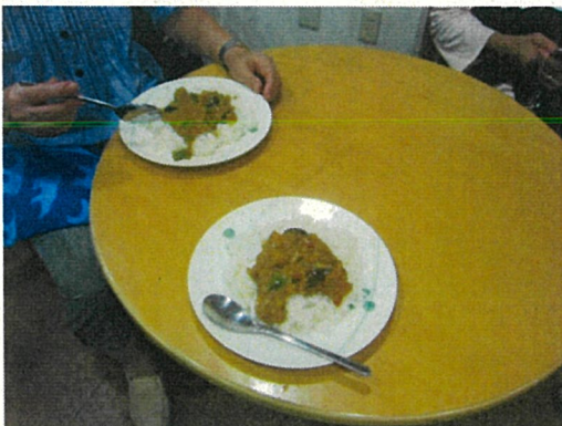
【団体No.1813】子どものたまり場「すこやかひろば」運営委員会 2回目 写真

本会には、民生児童委員の方や市の社会福祉協議会の方も参加しており、地域の子どもの会の会長さんもサポートしてくれています。会を発足して1年が経過しますが、参加人数が数人の時もありました。民生児童委員の方が日常の活動を通して気になっている児童を紹介してくれ、そんな子どもたちの居場所として機能するケースも生まれています。経済的だけでなく子どもがすこやかに成長するために必要な何かが足りない子どもも含めて来てくれる子どもにとって、ひろばが必要とされている場であれば、参加人数が多なくても存在価値があると思っています。そうした意味で、「ひろば」を設立した意味があったようです。昨年10月から子ども会の会長が6年生の間で、子ども間のトラブルを気にして対象の子どもたちを「ひろば」に連れてきてくれ、その時以降6年生が10人くらい毎回参加してくれています。子ども食堂の運営は、経済的にはかなり大変です。参加する大人からはボランティアで食事づくりをしてくれる人も含めて一人300円の参加費をもらっていますが、20歳未満の子どもの参加費は無料です。場所代、保険、食材費、雑費で必要な費用は、参加費だけでは賅えない状況です。2018年度は4回、「未来につなぐ募金」2018年度助成を得て、クリスマス企画など“プラスワン”の企画をすることができました。