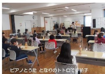
ピアノとたた となりのトトロで手拍子