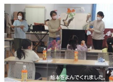
絵本をよんでくれました。