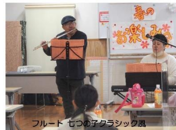
フルード 七つの子クラシック風