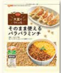
大豆でつくったそのまま使えるパラパラミンチ

A 「大豆で作ったパラパラミンチ」をご愛用いただき、ありがとうございます。 本商品は、規格などの変更を実施するためにしばらく企画を休止していましたが、6月1回のインターネット限定商品として企画を再開しました。7月1回より、おおむね8週に1回のサイクルで商品案内「Sanbonsugi (さんぼんすぎ)」にて企画しています。ぜひご利用ください。