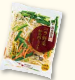
ニラ野菜炒め用ミックス

現在、ピーマン、玉ねぎが入った既存品はありませんが、東都生協で取り扱った場合の価格設定、利用の見込みなどを考慮した上で、新規商品を検討します。