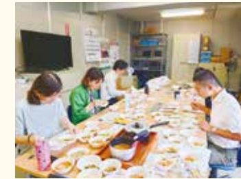
「おかずキット」商品開発試食の様子

今年度、商品部内に商品開発のチームを発足し、「おかずキット」を重点テーマとして開発に取り組んでいます。今後ご意見やご指摘をお聞きしながら、よりよい商品を提供できるよう努めていきます。