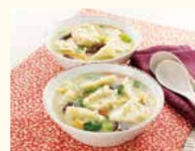
白湯水餃子スープ

「お届け日含め3日」の品ぞろえを増やすとともに、メーカーとも連携し、消費期限の長い製品の製造に対応できる衛生レベルを高度化した製造ラインの設置を検討していきます。