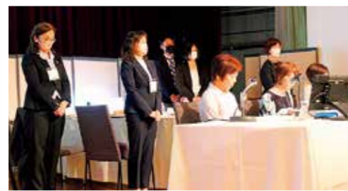
総代会前にあいさつをする 議事運営委員

議事運営委員は、議事が適正かつ円滑に進むように、総代、理事、職員から選ばれ、総代会当日に、議長を補佐します。