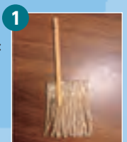
穂の両面テープの 剥離紙を剥がし、棒 を2/3の場所に置 き、半分の幅に折る