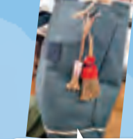
早速カバンに! 「かわいいわね」と声を 掛けられたら、「ぼうき」 の意味をお話します。