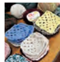
編みあがったモチーフ。自宅で編んでくださる方大歓迎!