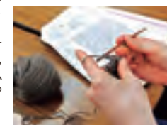
「編み物上手だったおばあちゃんの針なんです。使い込まれたツヤツヤの竹針で編むAさん。」