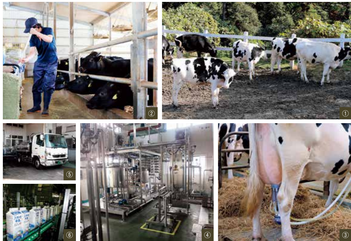
①育成牛舎の牛たち ②八千代黒牛の牛舎 ③搾乳の様子 ④HTST殺菌機 ⑤搾りたての牛乳を集乳車で毎日工場に運びます ⑥充填機