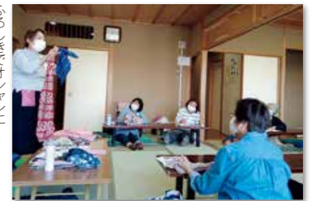
ふろしきでオシャレに 楽しくエコバッグ作り

消毒徹底や席の配置の工夫など感染防止に注意しながらの開催で計画段階から検討事項が山積みでしたが、数カ月ぶりに対面で行う学習交流会は参加者も主催者も明るい気持ちで学ぶ、楽しいひと時となりました。