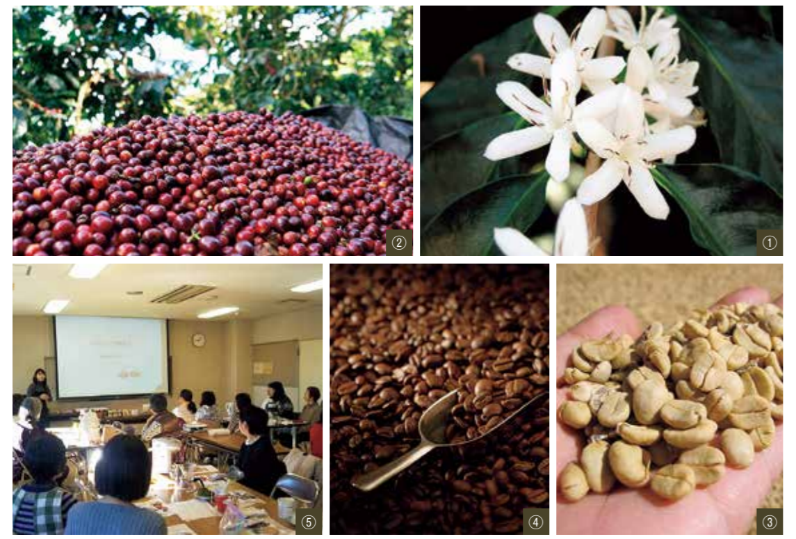
①コーヒーの花 ②収穫されたコーヒーの実(コーヒーチェリー) ③焙煎前の生豆 ④焙煎されたコーヒー豆 ⑤おいしいコーヒーの入れ方教室の様子(今年度はオンラインでのみ開催予定)

「京都 小川珈琲 炭焼珈琲」は、後味に余韻が残るしつかりとした味わいのアイスコーヒーです。この夏、ぜひお試しください。また、「小川珈琲店シリーズ」は、創業から受け継がれてきた専門店の味をご家庭でも楽しんでほしい、という熱い思いから生まれました。利用者が納得してコーヒーを楽しめるよう、パッケージにコーヒー豆の生産国とブレンド内容を表示しています。「小川プレミアムブレンド」はさまざまな個性を持つコーヒーの特徴を生かしたバランスの取れた味わいで、私たち珈琲鑑定士が自信を持ってお届け