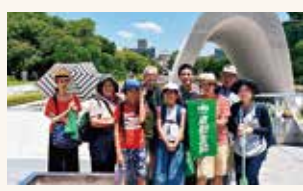
平和記念公園にて

な広島で戦争中にこんなに恐ろしいことが起きていたことを初めて知りました」などの声がありました。