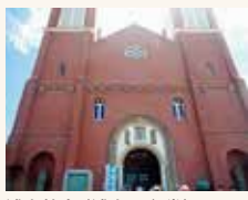
浦上教会(浦上天主堂)