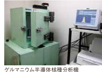
ゲルマニウム半導体核種分析機

「販売前に検査して(結果を)教えてほしい」とのご要望ですが、メーカーや産地の製造・栽培・出荷・配送スケジュールや作業体制などを考えると、全商品お届け前に検査を行うのは難しい状況です。 東都生協は福島第一原発事故発生以降、約3万検体以上の残留放射能検査を実施し、その結果は東都生協のホームページに掲載しています。 主な生鮮品・加工品は複数回(八千代牛乳)約400回、福島県産「きゅうり」約40回、「かその豚(精肉と加工肉)」約600回、茨城県産「鶏卵」約900回)検査しています。これらは現状「検出せず」であり、(同産地、同商品を継続的に検査している)ので、事前検査でなくても大きな問題は無いと考えています。 東都生協のホームページで「商品名」「生産量」「期間」「数値検出(あり、なし)」などのキーワードを組み合わせて検索すると、商品や地域ごとに残留放射能の大きな傾向が分かるようになってきています。ごく微量であっても食品から放射能を摂取しない選択として、非常に有効なツールですので活用ください。