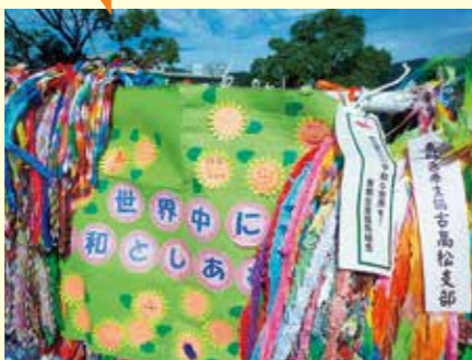
被爆の実相、悲慘さを実感し、学びました