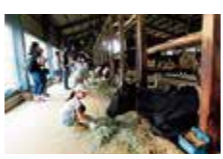
いっぱい食べておいしい牛乳を作ってね

酪農家を取り巻く環境は大変厳しいものですが、生産者と消費者のともに支え合う関係をこれからも大切にしていきたいですね。