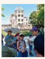
原爆ドームを背に