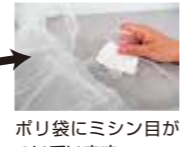
ポリ袋にメッシュ目がついています。