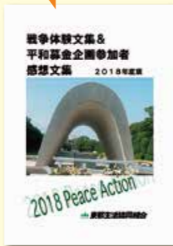
組合員から寄稿された文集を毎年発行