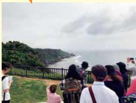
命の尊さ、平和への願いが深まりました