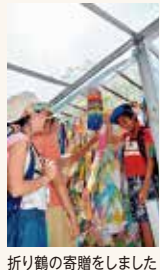
折り鶴の寄贈をしました

参加者からは「今回のこの学びをどう次の行動につなげていくかを親子で考えてみたい」。また、小学生の参加者からは「何事もなかったかのよう