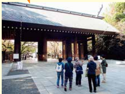
靖国神社、千鳥ヶ淵戦没者墓苑などをガイドさんの案内で巡りました