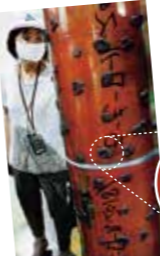
「もーもーロール」にイラストをプリントするプリント版

改革に取り組んできた工場での現場体験は、リサイクルの大切さを肌で感じられる良い経験になりました。